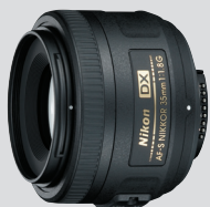
Obiectiv NIKKOR AF-S DX 35mm f/1.8G