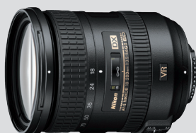
AF-S DX NIKKOR 18-200mm f/3.5-5.6G ED VR II