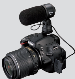
Microfon stereo ME-1