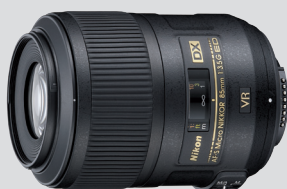
AF-S DX Micro NIKKOR 85mm f/3.5G ED VR